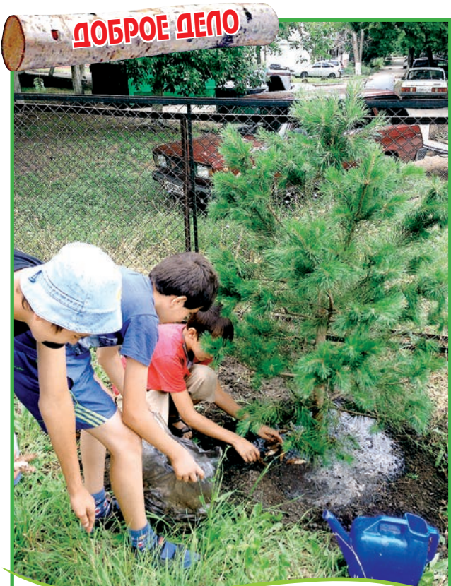
Еще одна сосна обыкновенная нашла новых друзей: сотрудники садового центра «Зелёный дом» подарили ее ребятам из новокуйбышевской школы-интерната «Перспектива».

И вообще, при выборе растений будьте нескромными и много спрашивайте у продавцов. А уж если Вы решили купить крупные, дорогие деревья — попросите, чтобы Вам показали аналогичный посадочный материал, который был высажен специалистами данного Садового Центра в предыдущие годы и посмотрите, в каком состоянии там эти растения. Их внешний вид будет красноречивей любых слов. Важно отметить, что в питомнике, как правило, условия выращивания отличаются от условий, которые создаются на участке, и что растению необходимо время для акклиматизации и освоения предоставленного пространства. Поэтому любому пересаженному растению необходим особый и более внимательный уход в первые 2-3 года.