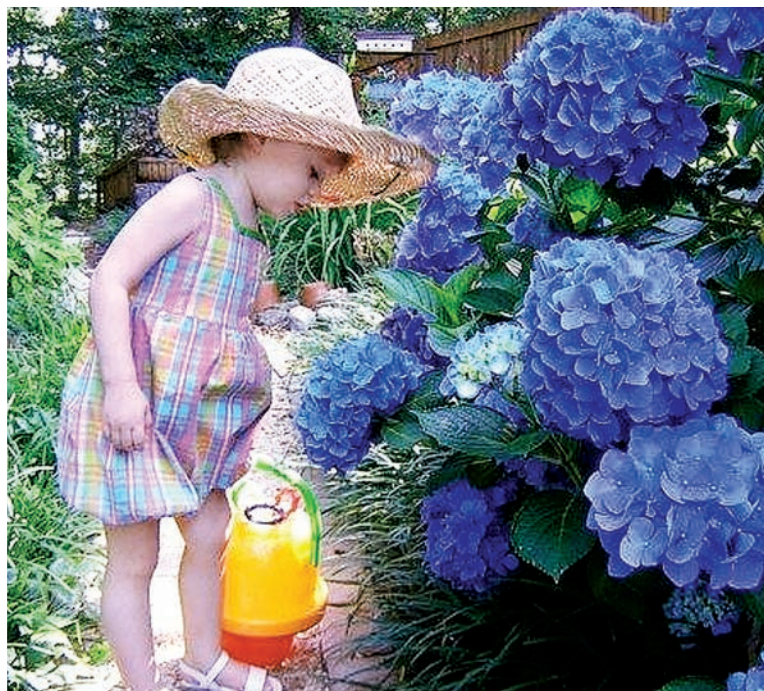
Гортензия поражает своим великолепием навал.

сти на этом «поле». Совсем избавиться от фитофторы такая мера не поможет, лишь в некоторой степени, зато почва обогатится органикой. Чтобы окончательно победить грибок, необходимо строгое соблюдение чередования культур и схем посадки, защита в процессе вегетации. Но если сосед по даче ничего не предпринимает, споры все равно прилетят — ничего не поделаешь!